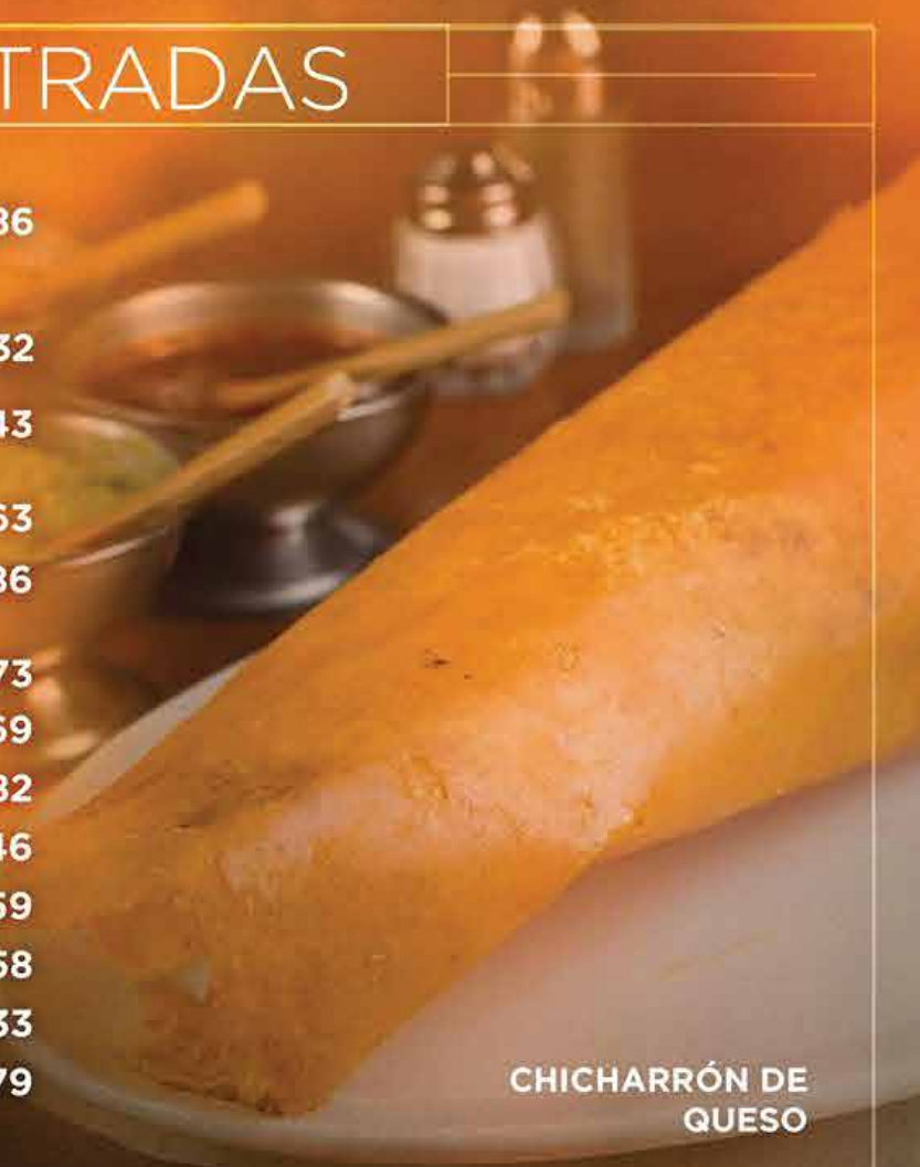
CHICHARRÓN DE QUESO