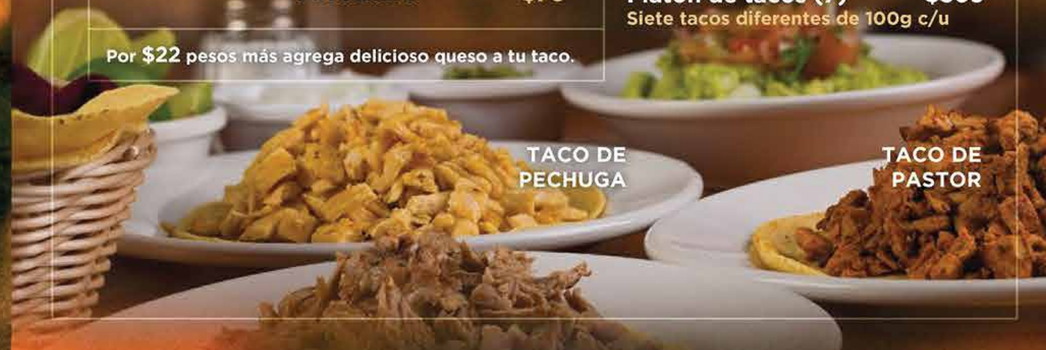
TACO DE PECHUGA

Por $22 pesos más agrega delicioso queso a tu taco.