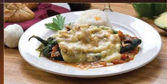
CHILE RELLENO DE ARRACHERA