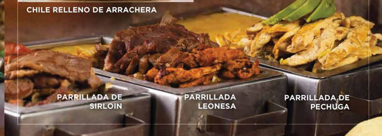
PARRILLADA DE SIRLOIN